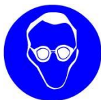
Dobro prilegajoča zaščitna očala v skladu z EN 166.